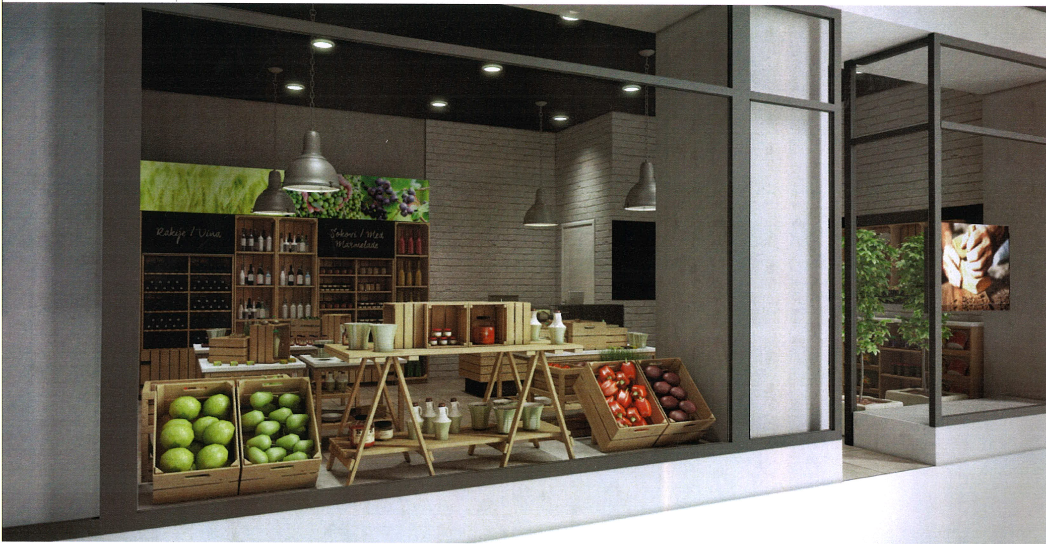
Vizualizacija idejnog rješenja — IZLOG