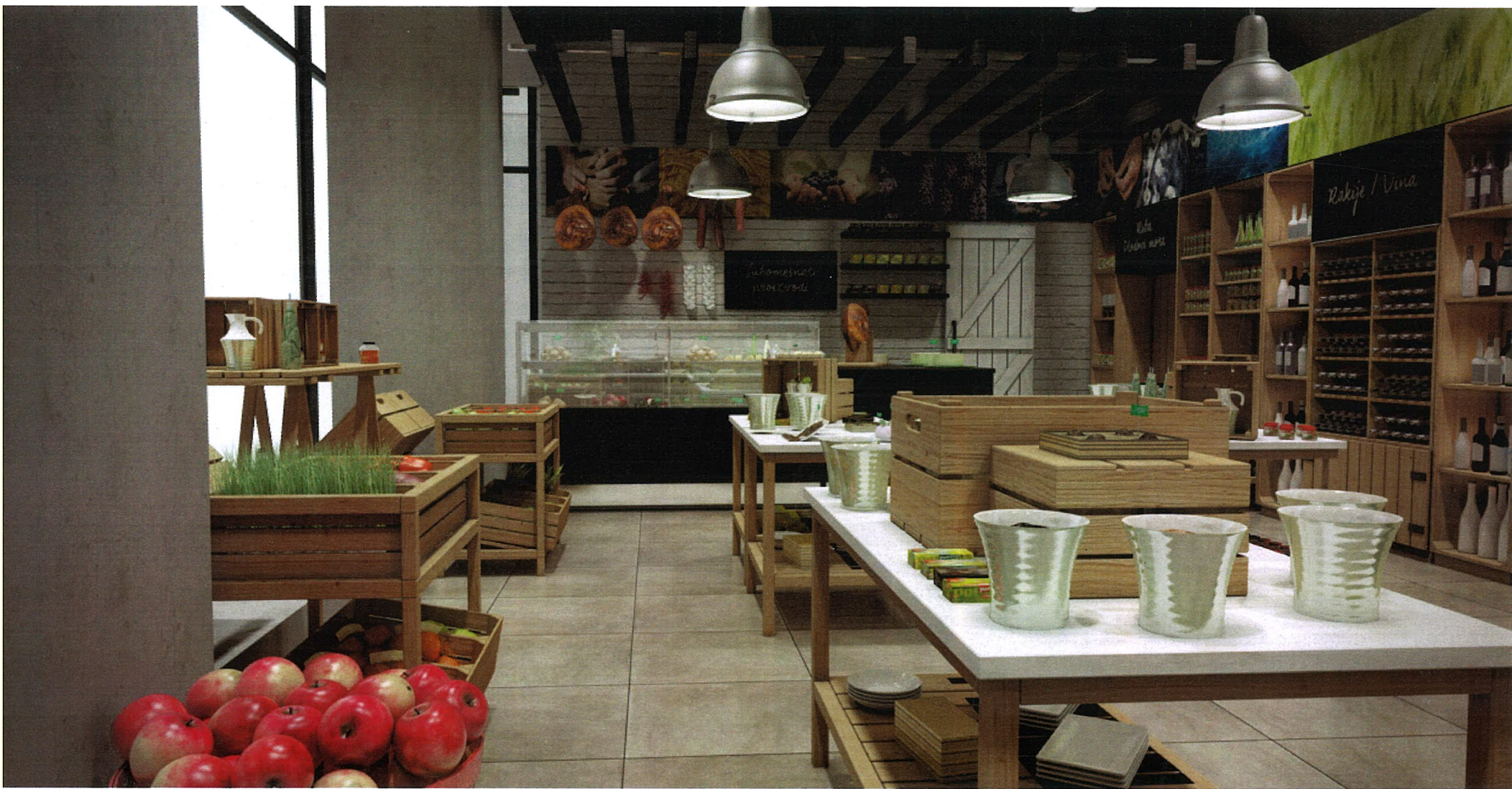
Vizualizacija idejnog rješenja — PROSTOR ZA IZLAGANJE PROIZVODA